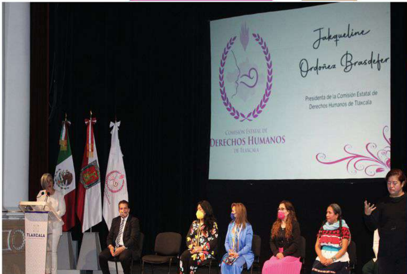
En acto público, la ombudsperson Jakqueline Ordoñez Brasdefer presentó su primer informe de actividades.

En su mensaje, la titular del Ejecutivo reconoció en la CEDH una de las instituciones de mayor compromiso con los derechos de la sociedad, y destacó que su trabajo contribuye al respeto, la dignidad, la igualdad, la justicia y la libertad de la sociedad tlaxcalteca.