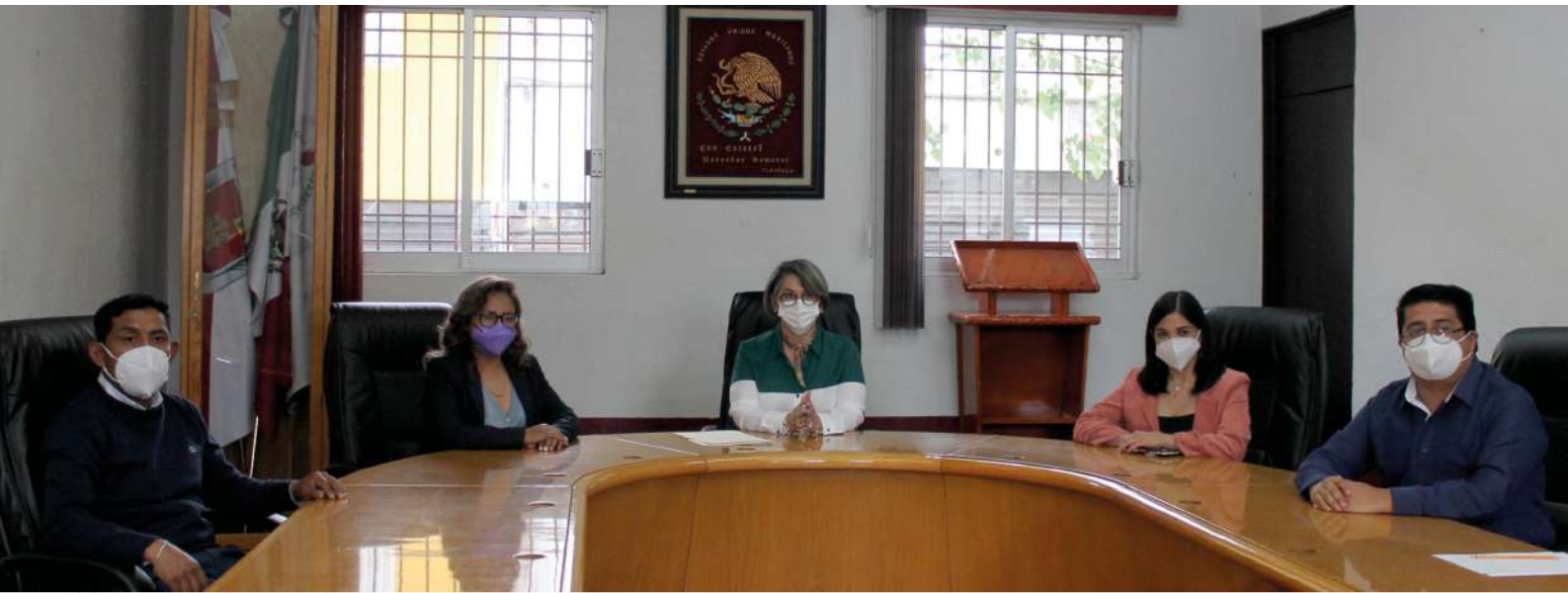
Integrantes del Consejo Consultivo de la CEDH

y podrán ser reelectos una sola vez por otro período igual, para lo cual se seguirá el procedimiento que para tal efecto establezca la ley de la materia”.