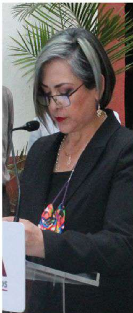
Jakqueline Ordoñez Brasdefer, presidenta de la Comisión Estatal de Derechos Humanos

a la Dirección de Seguridad Ciudadana y Movilidad del Municipio de Tlaxcala (DSCyMMT), así como a 6 servidores públicos de esa misma Dirección del ayuntamiento de Tlaxcala.