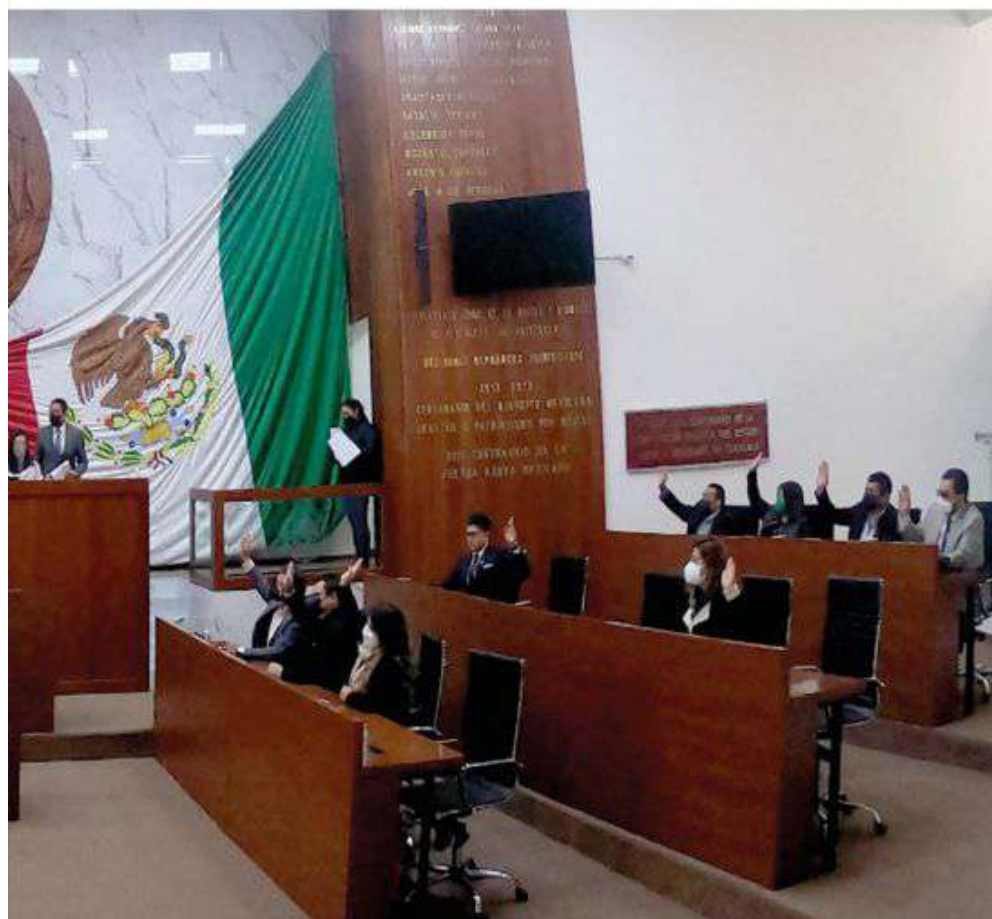
El Congreso del Estado recibió oficio de solicitud de comparecencia del presidente municipal de Apizaco